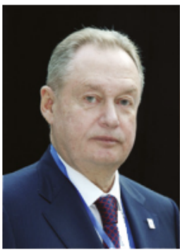
Михаил Посохин Президент Национального объединения изыскателей и проектировщиков

В разделе размещены приветственные слова представителей властных и административных структур Северо-Западного федерального округа, первых лиц строительного комплекса России и Северо-Запада, а также отраслевых национальных объединений.